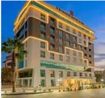
B BUSINESS HOTEL 4*