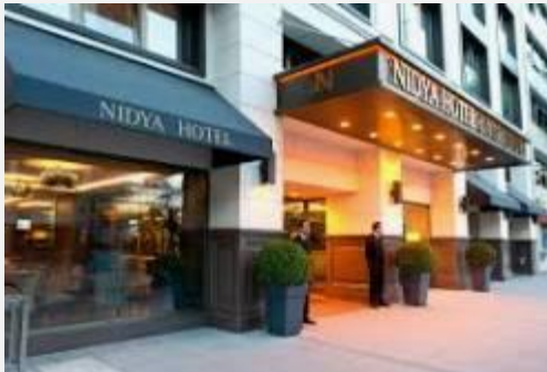
NIDYA HOTEL GALATAPORT 4*