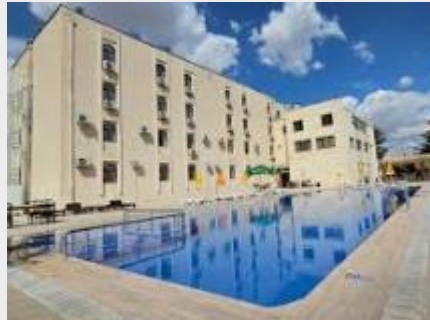
MIRARN SULTAN CAPPADOCIA 4*