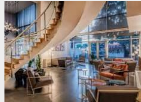
RADISSON BLU HOTEL 4*